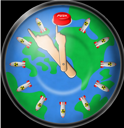
6 Doomsday Clock by difuOan

“Ik had graag gehad dat de Nederlandse regering zei: luister, die wapens dienen geen enkel doel meer, politiek noch militair, het is tijd dat zij uit Nederland en West-Europa worden weggehaald en wij nodigen de Amerikaanse regering uit om dat te doen. Die wapens dienen geen enkel doel en liggen letterlijk en figuurlijk alleen maar in de weg”.